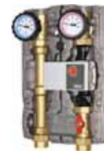
Kit hydraulique module température constante