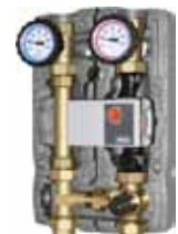
Kit hydraulique module température régulée

Unical FRANCE SA. 611 Route de Margnolas Le Mas Rillier 01700 MIRIBEL tél 04 72 26 81 00 - fax 04 72 26 47 48 - www.unical.fr