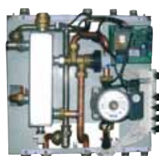
MT 3000 S ouvert